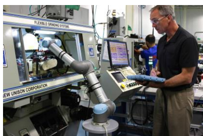
應用例子: Working with CNC Machines